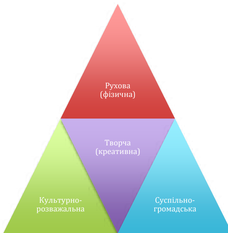
Рис. 2. Різновиди рекреації

Культурно-розважальна рекреація має за мету інтелектуальне вдосконалення особистості у процесі, наприклад, читання художньої літератури, інтелектуальних розваг, інтелектуальних ігор, колекціонування тощо [9].